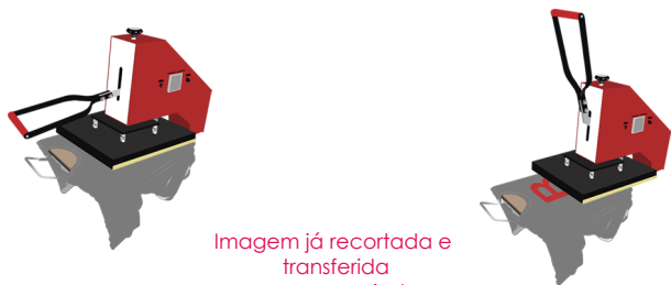
Imagem já recortada e transferida para a camiseta