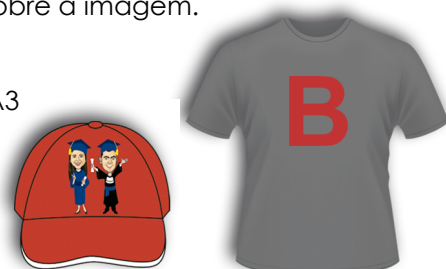
Imagem Finalizada no Tecido